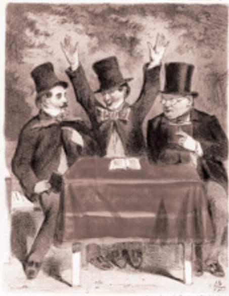
Conversation im Paradeis- garten

Sohnbediente: Wonn's denn auf'n Vatter net so flock? Kartandelmacher: Gar kein' Dier! So auch net möglich! denn von Oben herunter weinen is leicht, aber von Unten hinauf weinen, geb' net, is ja anstrengend.