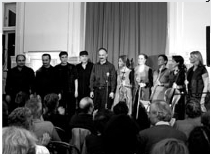
Das „Dato Malazonia Ensemble“ und „das böse salonorchester“

höchsten Tönen schrie er nach einem Tschick („Dschali“) oder resümierte rezitierend: „Mir san mir“ (beide: Dienz/ Rühm). Das Programm war rund und forderte die subtile Klangfülle eines Schrammelquartetts, das geradezu prädestiniert scheint, aus der verklärten Gemütlichkeit der Wiener Walzer und Märsche in die Moderne zu gleiten.