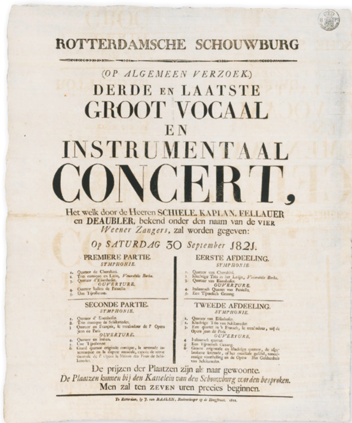
Konzertankündigung Rotterdam Drittes und letztes Vokalkonzert Stadsarchief Rotterdam GAR_01_1821-09-30_X

eine war blind, mit ihren »auf oberösterreichische Art gebildeten Stimmen« auf dem Theater in der Leopoldstadt und auf dem Theater an der Wien Jodel-Lieder. 14 Ca. 1830 beginnen namhafte italienische und französische Opernkomponisten die Tyrolienne (Jodelarie) in ihren Werken zu verwenden. Der Höhepunkt der Jodelmode in Europa ist ungefähr 1829 erreicht mit der Tirolienne in der Oper Wilhelm Tell von Rossini. Der Reiseschriftsteller August Lewald berichtete 1835: »in Wien musste vor zehn Jahren in allen sogenannten Localstücken gejodelt werden; jedes Lied endete mit dem Jodeler; aber in diesem Augenblick ist die Liebhaberei dafür wieder verschwunden. Vor einigen Jahren noch musste es selbst in französischen Opern häufig vorkommen, um das Publicum zu ergötzen, wie z.B. in der Braut von Auber. Rossini's Tirolienne im Tell war die Losung dazu für alle andern Componisten geworden. Jetzt ist dafür das Jodeln in Italien Mode und Bellini und Donizetti verschmähten es nicht, häufige Anklänge von Tirolerliedern in ihre Compositionen zu verweben. Selbst Anna Bolena, die unglückliche Königin, haucht ihren Schmerz in einer Tirolienne aus.« 15