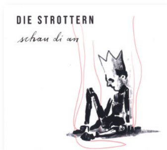
Die Strottern: schau di an © + p 2021 cracked anegg records LC 09587, crack 0076 Erhältlich im wvlw € 18,-

Das Klangspiel, das Karl Stirner mit oder für uns treibt, führt in unbekannte, faszinierende Gefilde. Dafür verlangen diese Kompositionen ein sich Einlassen und Hinwenden, sie lassen einen staunen und sind streckenweise durchaus herausfordernd. Eine genussvolle Reise in die Tiefen der Stirnerschen Klangwelten. Für 39:29 Minuten eintauchen – mysteriös, groovig, atmosphärisch. Einfach zauberhaft ... – jl