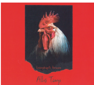
Gesangskapelle Hermann: Alles Tango Erhältlich unter gesangskapellehermann.at/shop € 15,- (zzgl. Versandkosten)