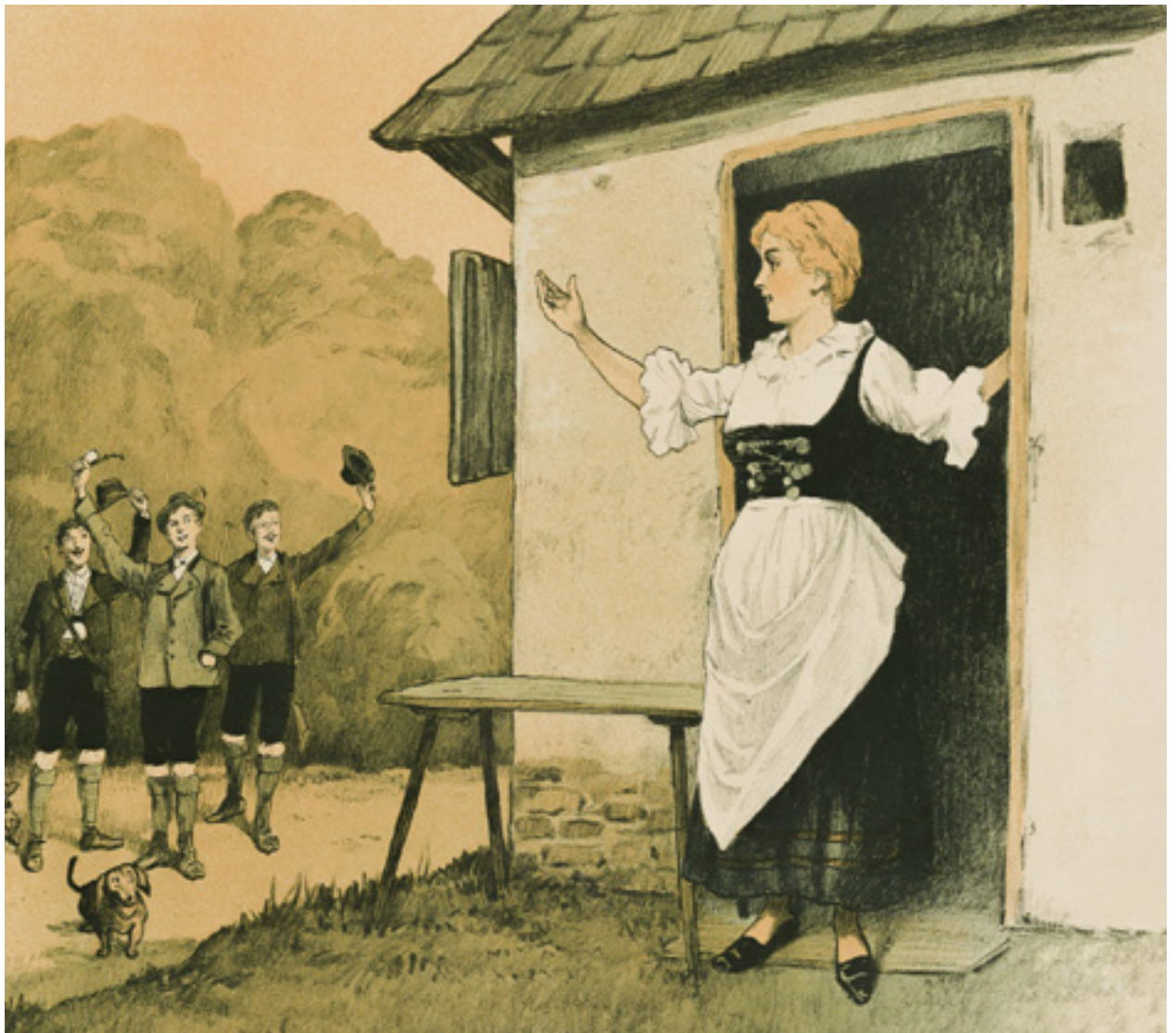
Notenblatt-Cover von »D'Jaga san då« mit Musik von Rudolf Kronegger und einem Text von Karl M. Jäger (Ausschnitt, Verlag Josef Blaha)

Einen erschwinglichen, öffentlichen Konzertbetrieb im heutigen Sinn gibt es erst ab dem letzten Drittel des 19. Jahrhunderts. Das ist nicht nur in Wien so, sondern weltweit. So entstehen innerhalb weniger Jahrzehnte viele stadttypische Musikstile, die heute auch wesentlicher Bestandteil der Tourismusfolklore sind: Canzone, Fado, Habanera, Tango, Flamenco, Musette, bis hin zu Jazz und Rembetiko. Wir finden hier eine evidente funktionale – nicht unbedingt musikalische – Verwandtschaft. Diese Musikformen sind außerdem auch Identifikationsvehikel im Zeitalter des Nationalismus und des Partikularismus. Und sie bleiben sich durch alle musikalischen Einflüsse und Moden hindurch »treu«, also erkennbar. Auch das Wienerlied hat Shimmy, Foxtrott, Tango, Jazz und Blues hinter sich und schlägt sich gerade tapfer mit Pop und Rap, aber auch zeitgenössischer Musik herum. Das Wienerlied ist von Beginn an und